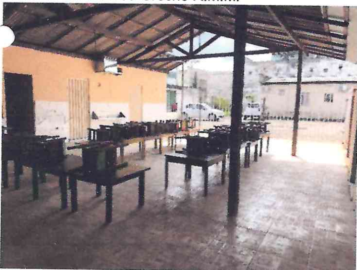
Foto 5 - Área de Recreação da Creche R.M.M.