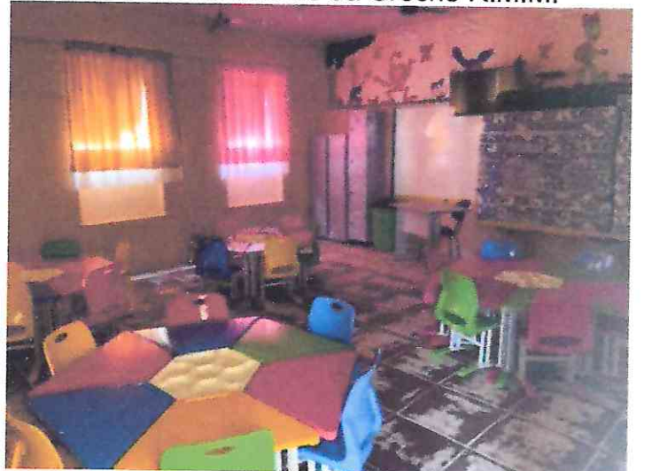
Foto 6 - Sala de aula I da Creche R.M.M.