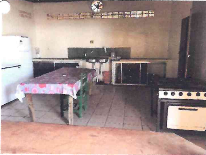
Foto 3 - Cozinha da Creche R.M.M.