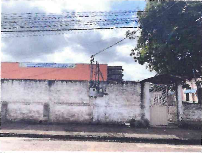
Foto 1 - Fachada da Creche R.M.M.