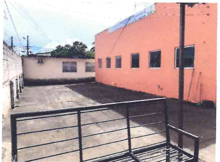
Foto 2 - Área externa da Creche R.M.M.