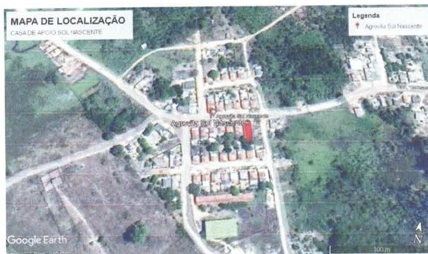
Mapa de localização

03-ENDEREÇO DE LOCAÇÃO: Agrovila Sol Nascente KM28, Distrito Assurini, Altamira-PA.