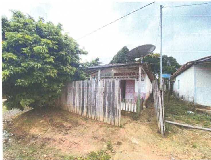
Imagem 1 – Fachada Frontal.