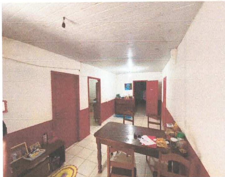
Imagem 3 – Sala.