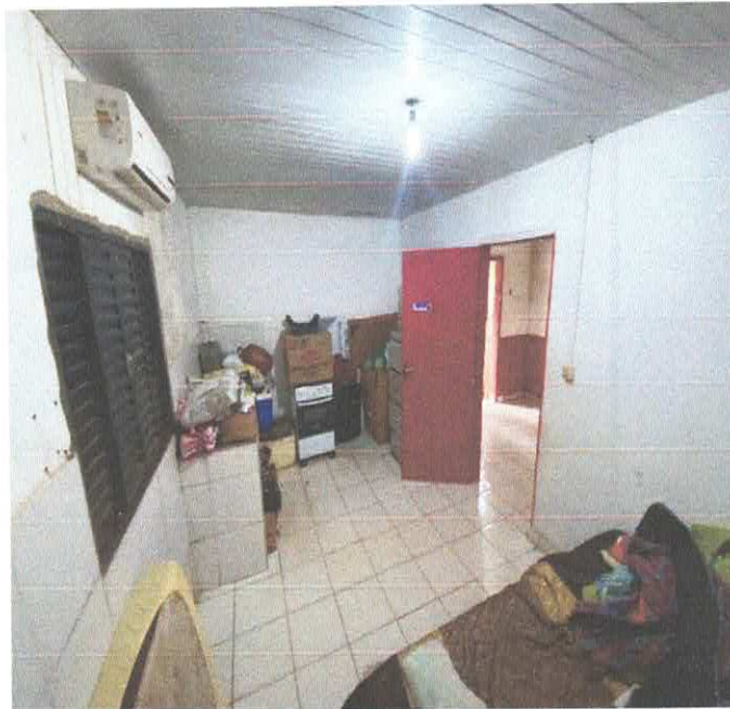
Imagem 7 – Depósito.