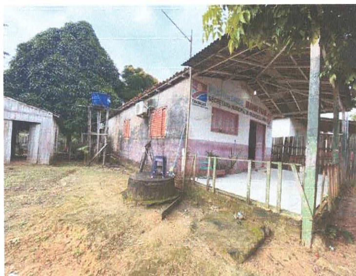
Imagem 2 – Fachada Lateral.