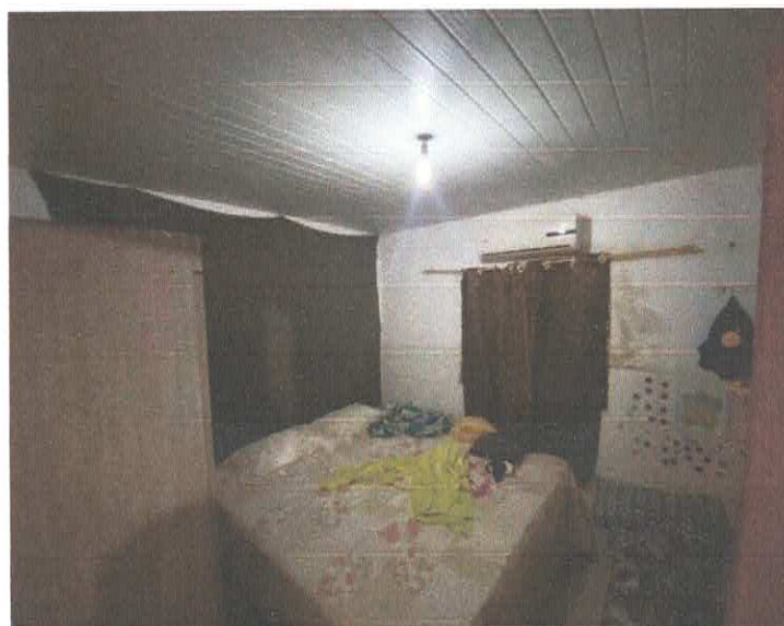
Imagem 4 – Quarto.