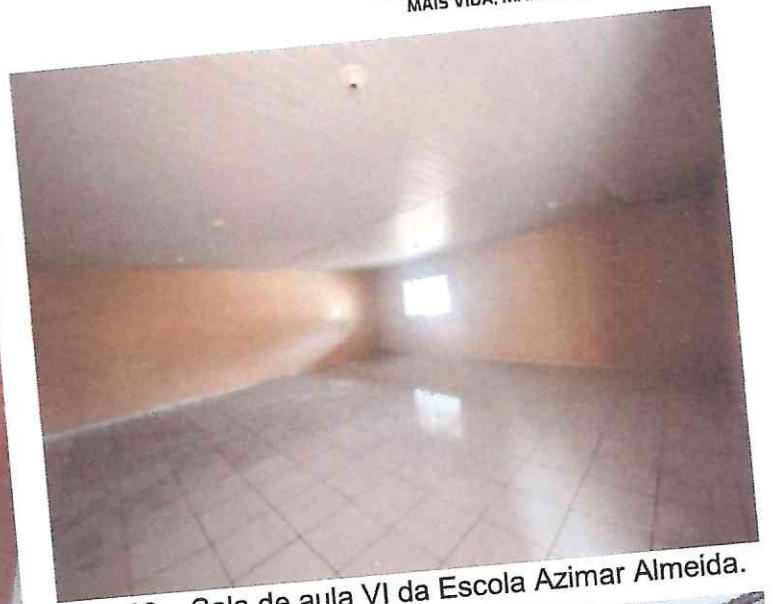
Foto 08 _ Sala de aula VI da Escola Azimar Almeida.