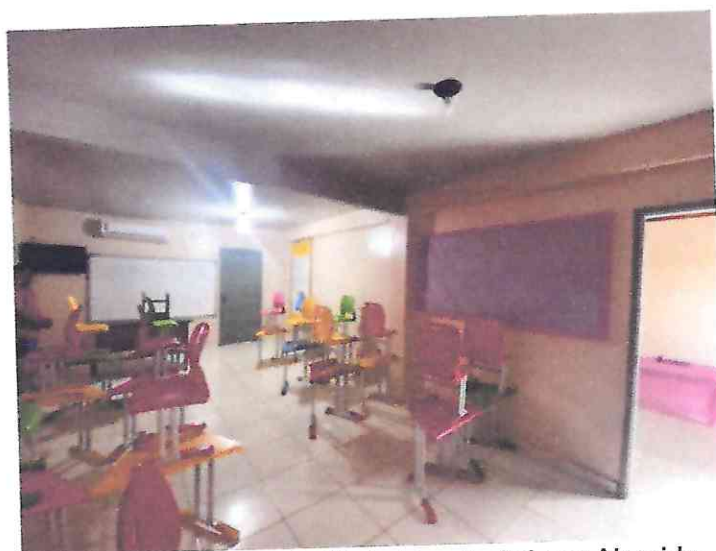
Foto 05 - Sala de aula III da Escola Azimar Almeida.