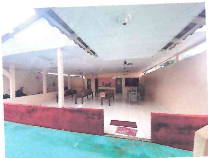
Foto 01 - Área de refeitório da Escola Azimar Almeida.