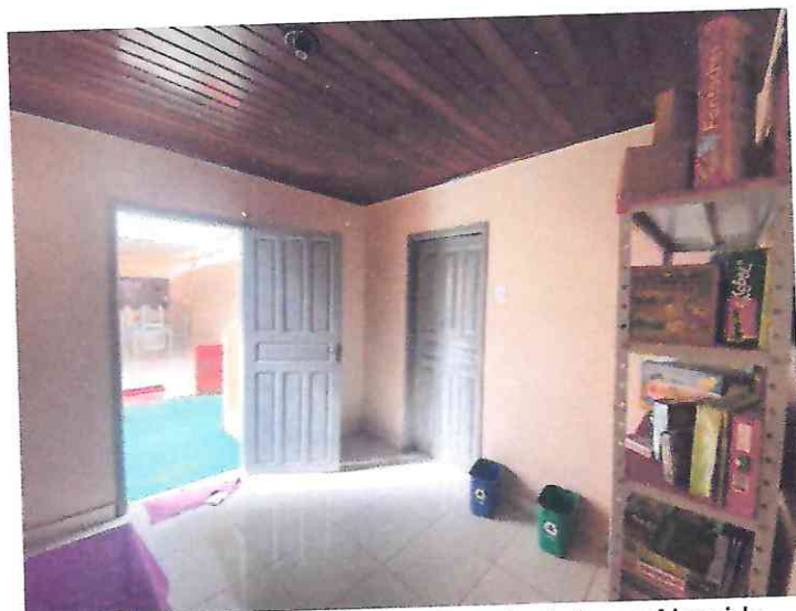
Foto 02 - Sala de leitura da Escola Azimar Almeida.