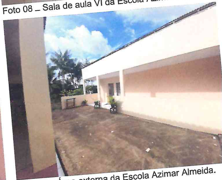
Foto 10 _ Área externa da Escola Azimar Almeida.