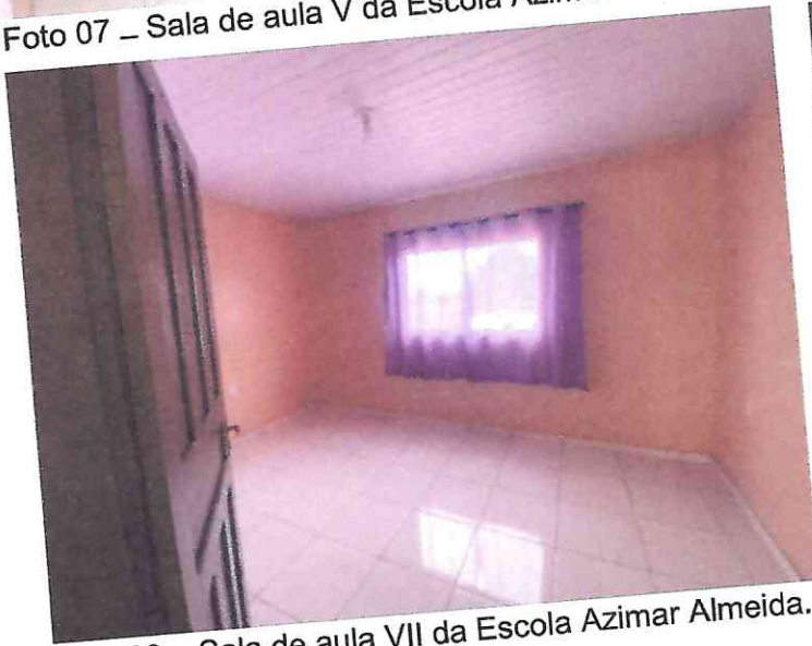
Foto 09 _ Sala de aula VII da Escola Azimar Almeida.