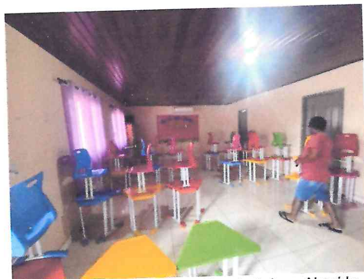
Foto 06 - Sala de aula IV da Escola Azimar Almeida.