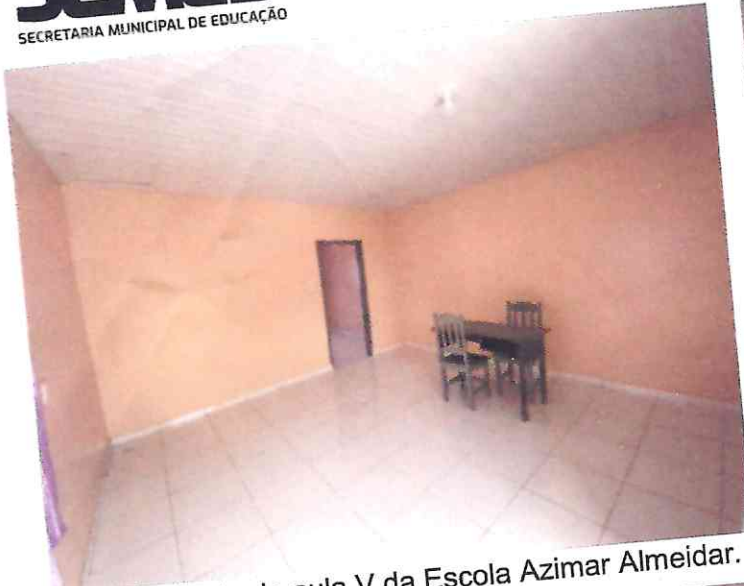
Foto 07 _ Sala de aula V da Escola Azimar Almeida.