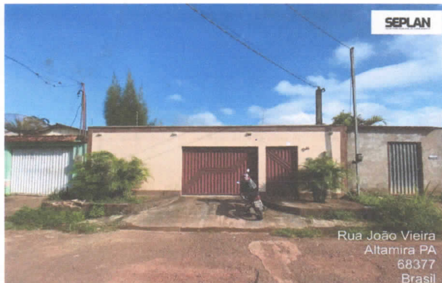
Imagem 1 – Fachada Frontal.