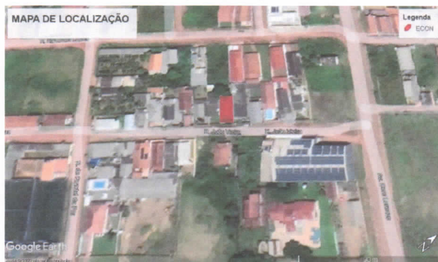
Mapa de localização

03-ENDEREÇO DE LOCAÇÃO: Rua João Vieira, CEP: 68376767, Bairro: Parque Residencial Dom Lorenzo, Altamira-PA.