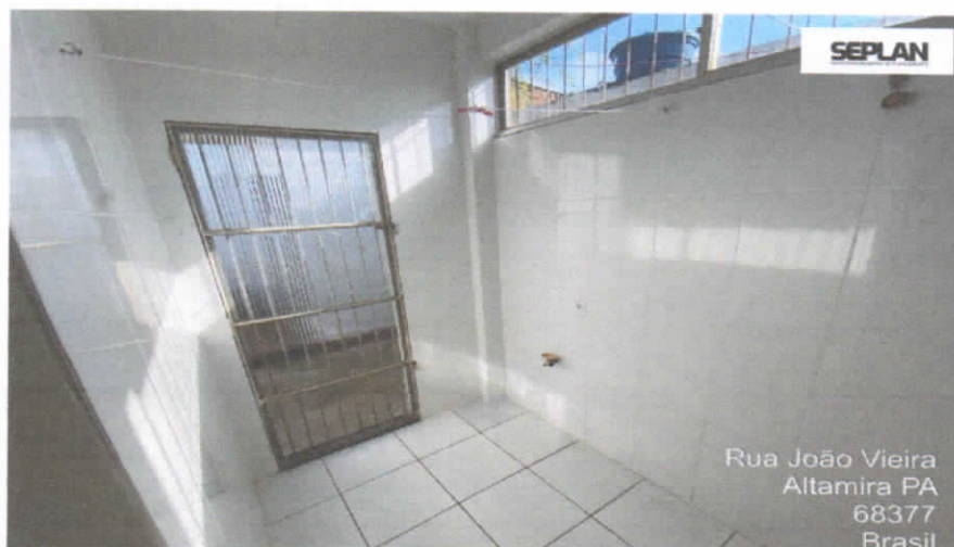
Imagem 11 – Deposito.