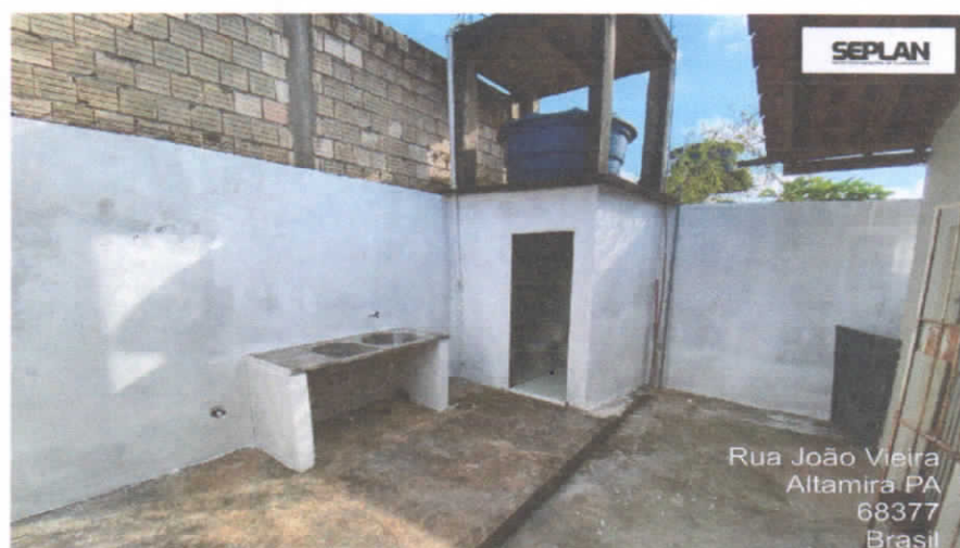
Imagem 13 – Área de serviço e banheiro externo.