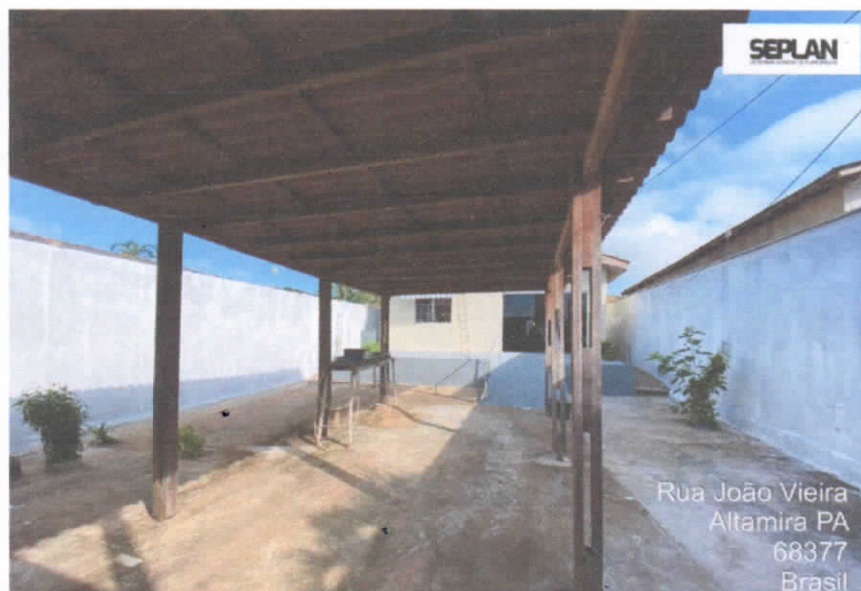
Imagem 2 – Fachada frontal interna.