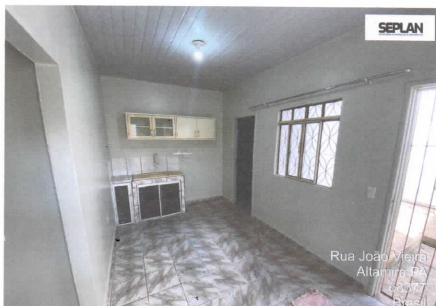
Imagem 12 – Área de serviço.