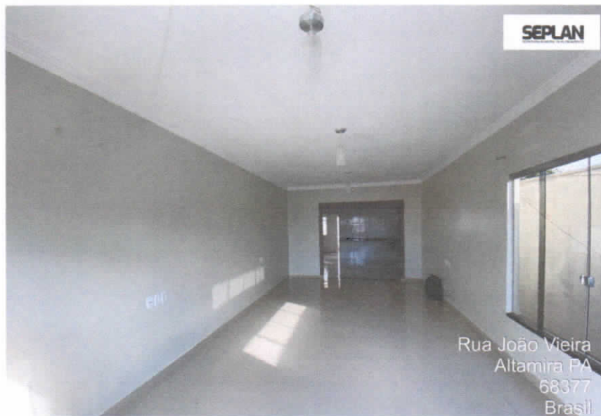
Imagem 3 – Sala de estar.