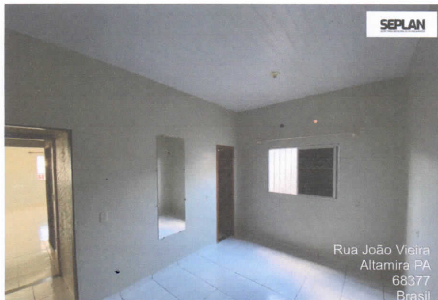
Fonte: SEPLAN, 2022.