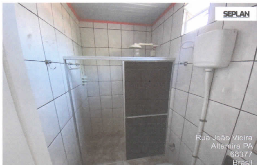
Fonte: SEPLAN, 2022.