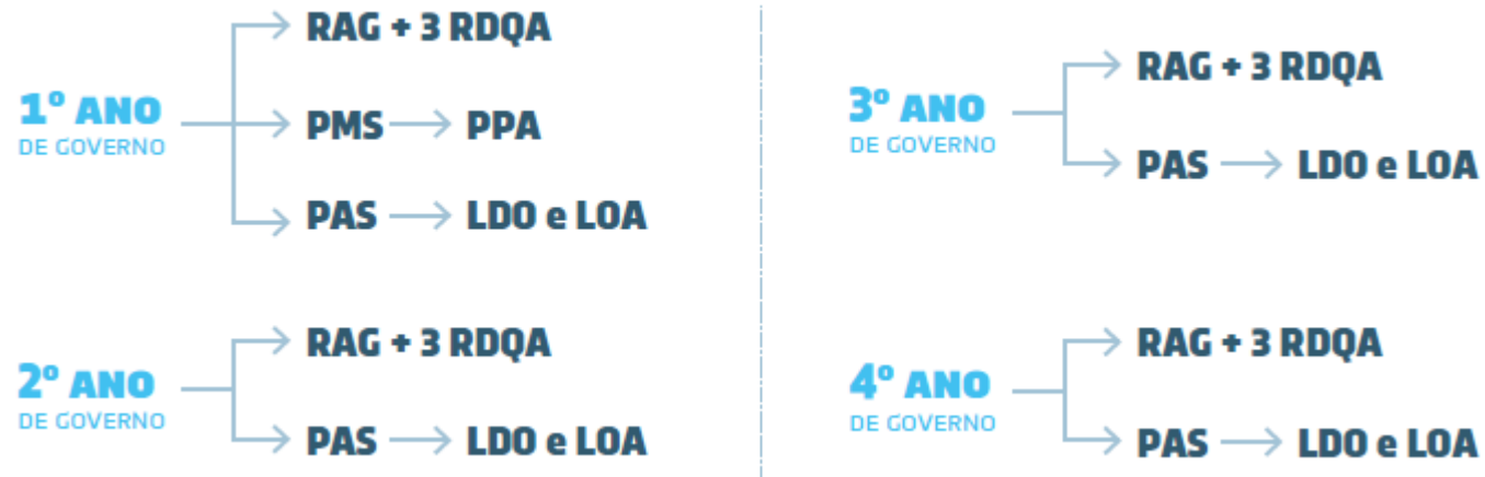
Figura 1 Cronograma dos instrumentos de planejamento e orçamento.