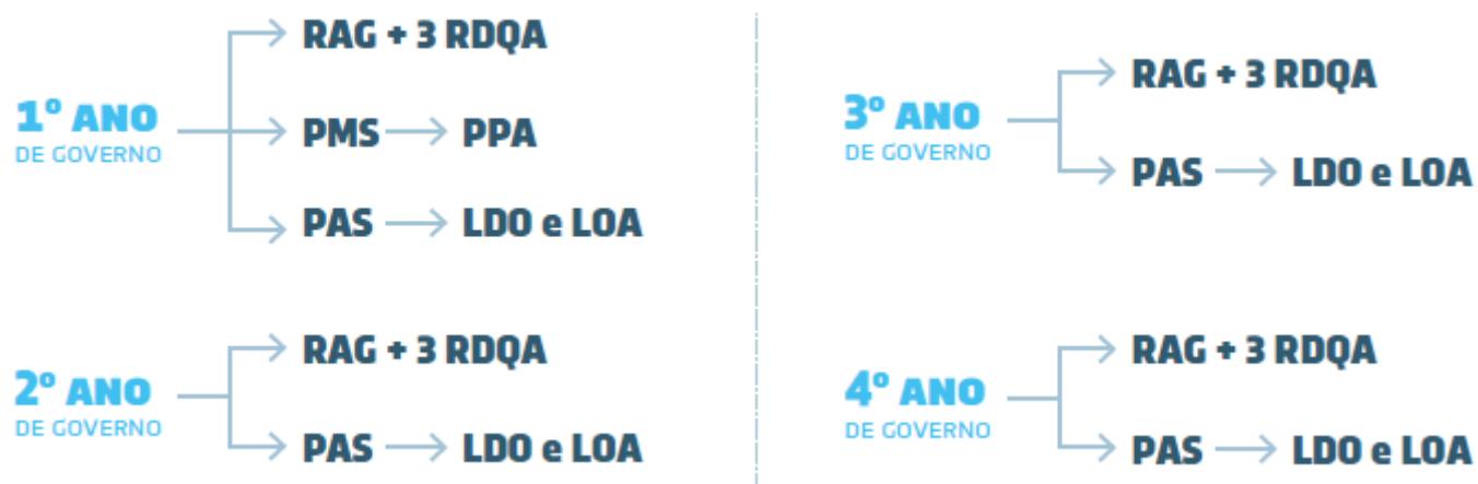
Figura 1 Cronograma dos instrumentos de planejamento e orçamento.