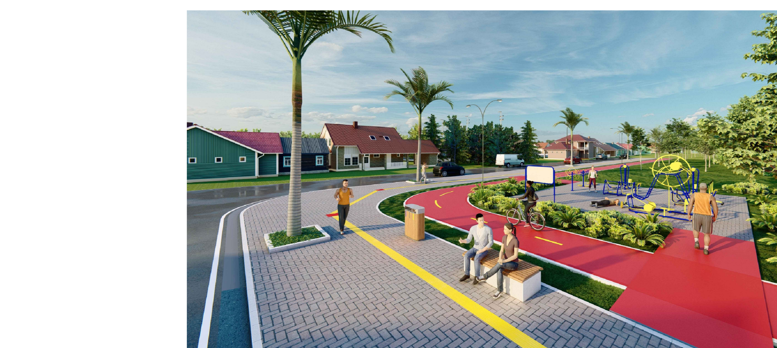
PERSPECTIVA 01 - ACADEMIA AO AR LIVRE