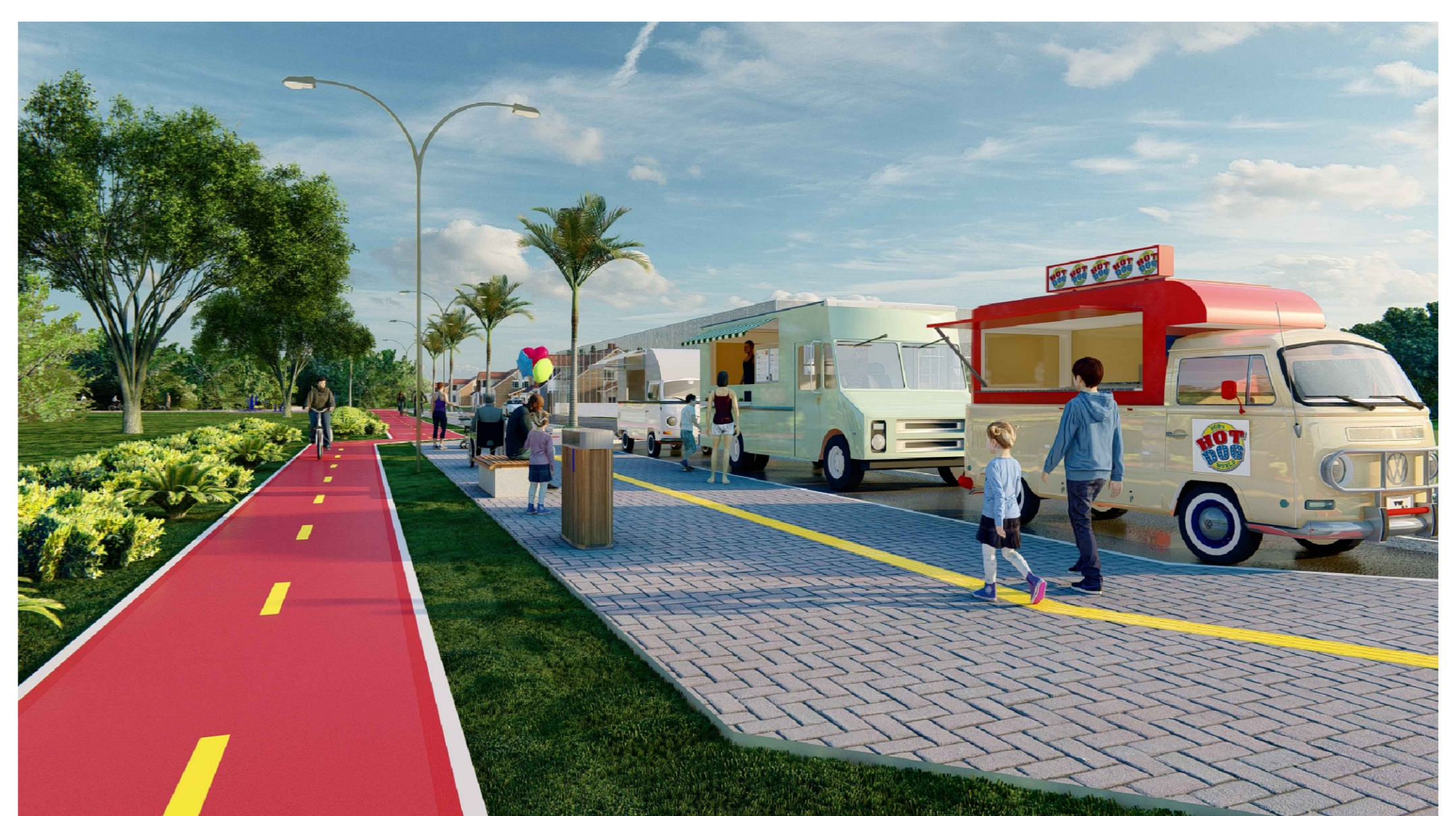
PERSPECTIVA 02 - ESPAÇO PARA FOOD TRUCKS